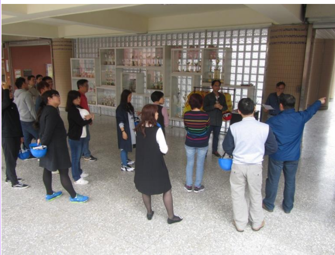
演習完做檢討會議並提供相關意見