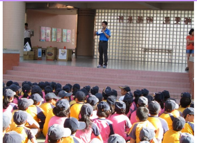
主任於升旗時進行防災教育