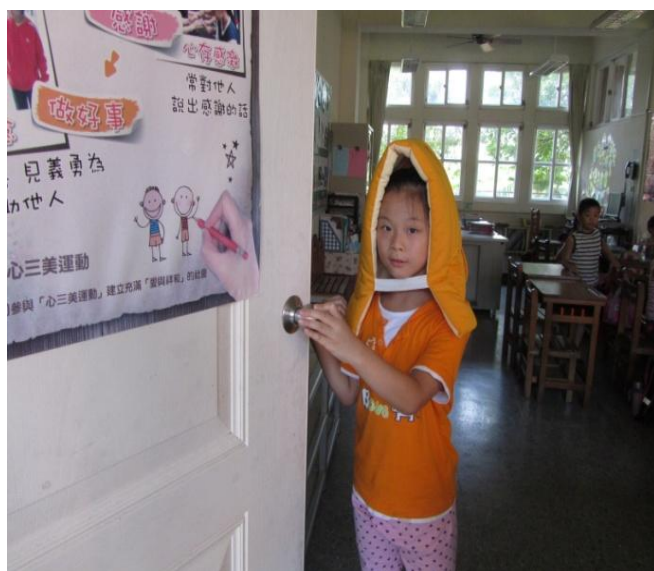
避難時的注意事項-開門