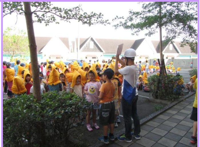
避難點老師集合與點名