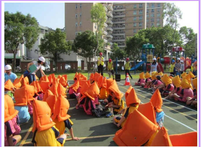
至避難點後校長進行防災教育