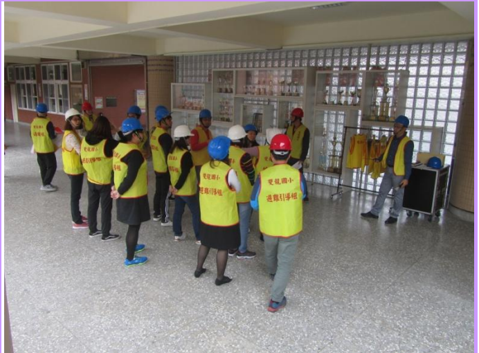
防災小組成員討論逃生動線