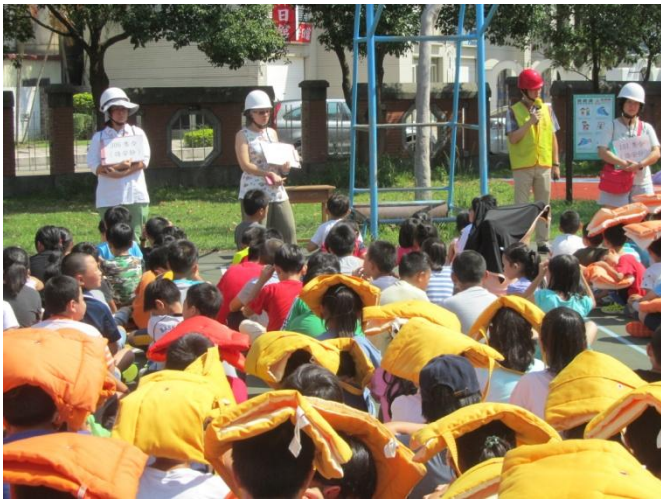
由校長主持防災演練活動