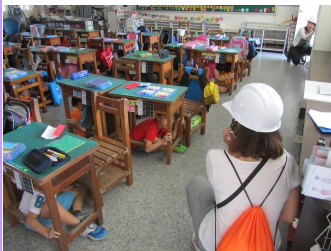
老師解說正確的掩蔽動作