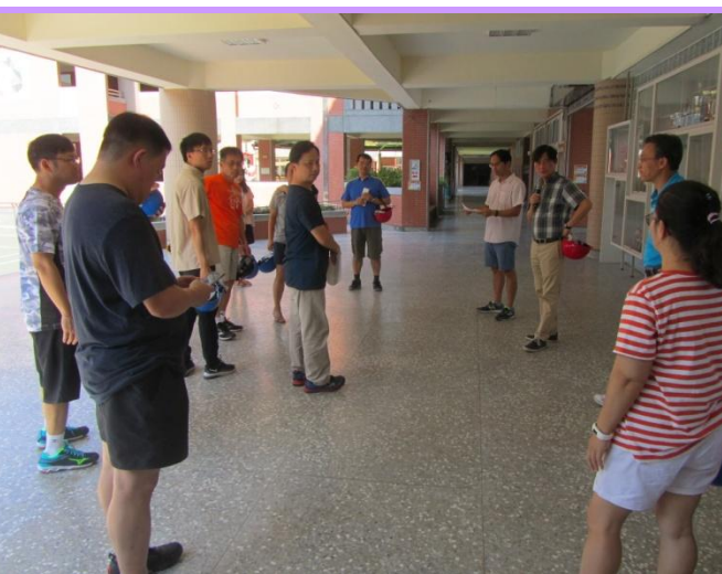
校長主持準備會議