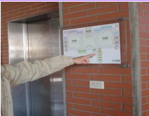
避難路線公告於各樓梯口